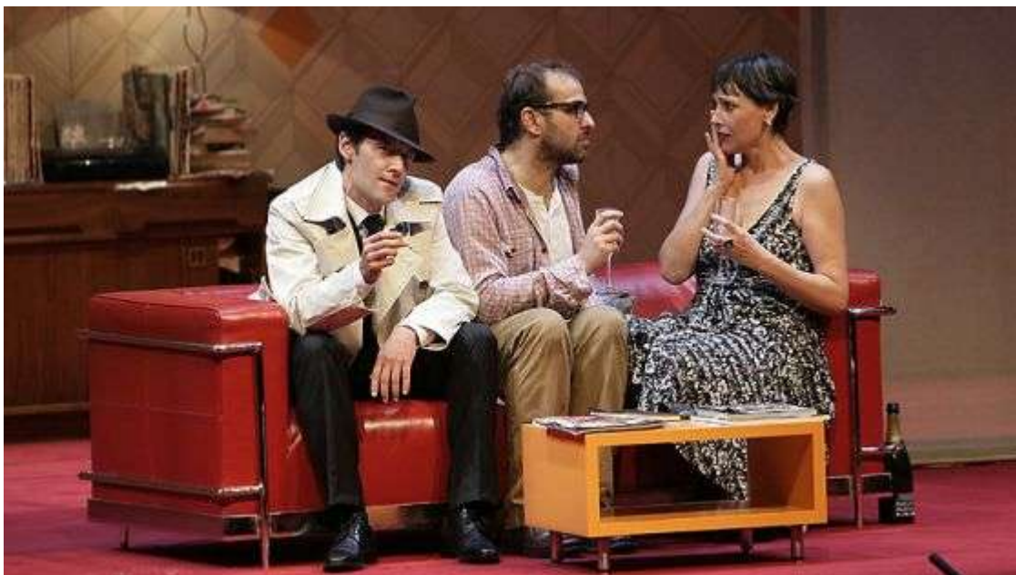
Un momento de la representación de la obra de Woody Allen

Silvia Hernando Madrid 25 ENE 2012 - 16:43 CET