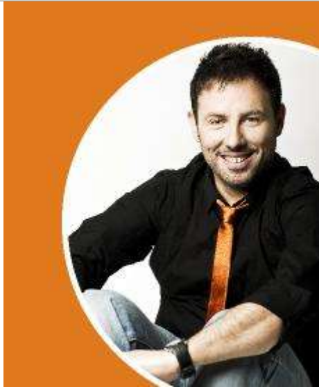
Inaki Urrutia protagoniza esta comedia.