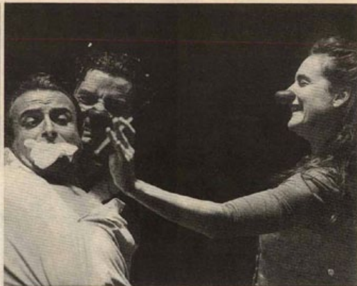
Los cantantes líricos se han integrado con eficacia al elenco de Els Joglars

La rutina o la pereza mental hará que se hable de "El Nacional" -ya lo verán- como una muestra del teatro en el teatro, lo cual, a mi entender, será un error de bulto. En todo caso, la propuesta constituye un ejemplo de teatro "con" el teatro, una diversión que tiene por materia prima ese "oficio teatral" que agoniza entre assessors, consellers i departaments ministerials". La obra se instalará a partir del próximo miércoles en el Tivoli y habrá ocasión de comentarla con cierto detenimiento, tras un estreno que ha reve-