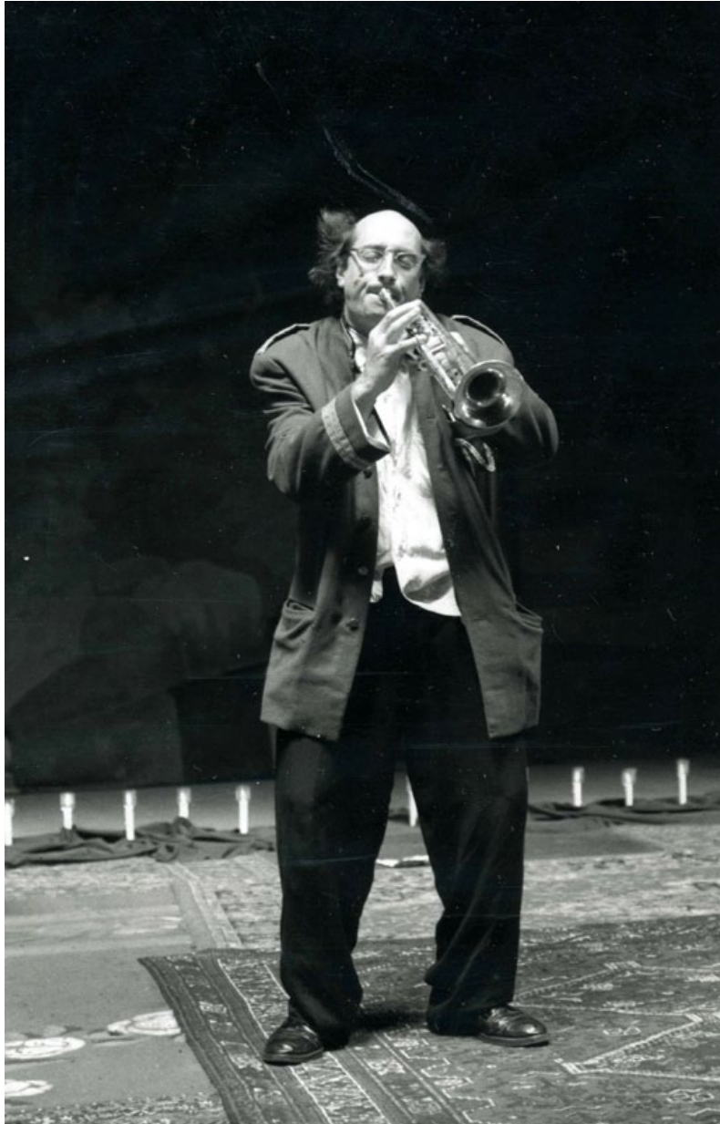
El Nacional 1993