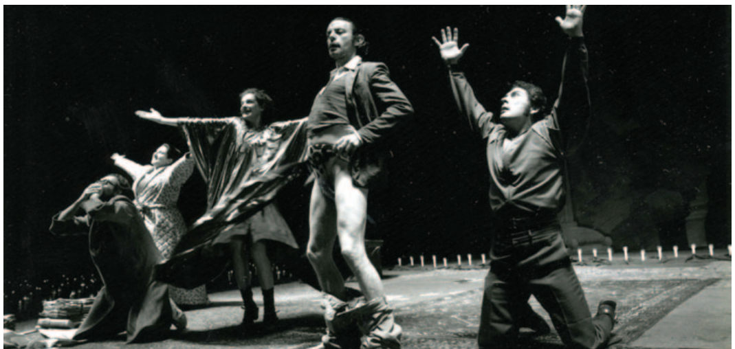
El Nacional 1993

Las dificultades para controlar y adiestrar a los indigentes cargados de violencia entre ellos, la penetración del argumento de Rigoletto entre su delirio o las intervenciones exteriores para desalojar el local y demolerlo, son algunos de los conflictos que Don José deberá afrontar tenazmente a lo largo de la obra. Pero su resistencia para aceptar la realidad exterior de un mundo que ya funciona sin el teatro lo abocará a un desenlace numantino, acompañado por el canto y la música del Rigoletto de Verdi.