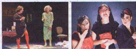
ARRIBA, ESCENA DE INCREMENTUM . ABAJO, LOCAS POR PEPE EL NAPOLITANO Y CON LA MUERTE EN LOS TACONES

vos del Español, en el Matadero, hasta el 31 de julio.