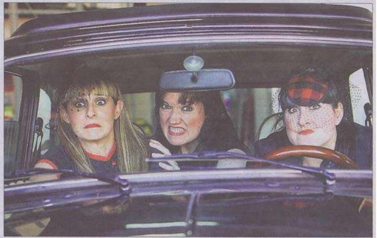
Las tres actrices caracterizadas para la obra en el taller de mecánica clásica Albayda.

Tres hermanas que parten de Parla y llegan a Los Urrutias, en Murcia, para cumplir la última voluntad de su madre, que acaba de fallecer. El periplo de 450 kilómetros les sirve de pretexto para experimentar situaciones deli-